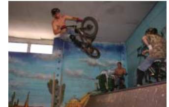
Action im „Madhouse“

Geld benötigen. Die Jugendtreffs brauchen meistens keine große Summen – 2.000 Euro genügen, um beispielsweise den Jugendtreff „Miteinander“ vorm Aus zu bewahren. Wenn ernsthaft darüber diskutiert wird, mit 400.000 Euro das Stadion „Vogelgesang“ auszubauen, dann sollte es an 18.000 Euro für die Jugendarbeit nicht mangeln, so die Argumentation der jungen Parlamentarier. Die LINKE unterstützt die Forderung des KijuPa und warnt davor, nach dem Prinzip der sogenannten „demographischen Rendite“ zu handeln. Denn nur weil es weniger Jugendliche gibt heißt das noch lange nicht, dass diese weniger Ansprüche haben und ihnen weniger Geld zur Verfügung stehen sollte.