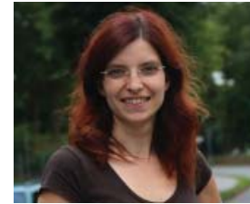
Diana Golze, MdB

Die Entscheidung der SPD-Spitze, Außenminister Frank-Walter Steinmeier als SPD-Kanzlerkandidaten zu küren, überraschte nicht. Wie in diesem Zusammenhang