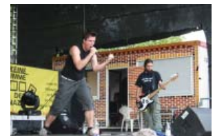
Festival „Laut und Bunt“ 2008

nichts los ist und alle jungen Menschen die Kreisstadt fluchtartig verlassen. Ist es Angst vor zu viel Lebensfreude oder einfach nur das Verlangen nach einem Sicherheitsgefühl, das jeden Bürger in einen Glasschrank mit Watte setzen soll? Ruhe, Sicherheit und Ordnung sind in letzter Zeit zu den höchst angesehenen Maximen unserer Stadt geworden, was sicherlich seine Berechtigung hat. Doch sollten wir bei all der Ruhe und Ordnung nicht vergessen, dass eine ruhige Stadt ganz schnell eine tote Stadt werden kann.